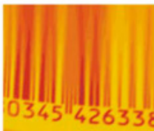
Código de barras